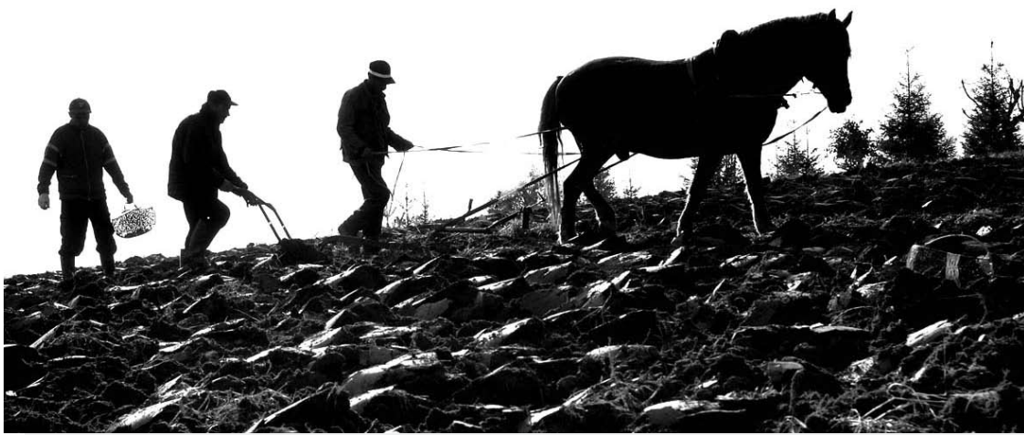
Derlius buvo viena pagrindinių temų 1952–1957 metų „Kolektyviniame darbe“. „Auksinės varpos“ kolūkis kritikuotas, kad neįvykdo išdirbio normos ir jame net nėra tarpbrigadinio lenktyniavimo.

Bene pagrindinė ir svarbiausia tema, rutuliojama 1952–1957 metų „Kolektyviniame darbe“ – sėjos darbai. Kone kiekviename laikraščio numeryje aptariama, kaip tinkamai pasiruošti sėjai, kada ir kaip sėti linus, kukurūzus, bulves. Šiais laikais tokias aktualijas skelbia nebent specializuota spauda, todėl, perbėgus per šių penkerių metų laikraščio puslapius, įdomu sužinoti (prisiminti) tai, kas anuomet buvo svarbiausia skaitytojui ir rajono gyventojams.