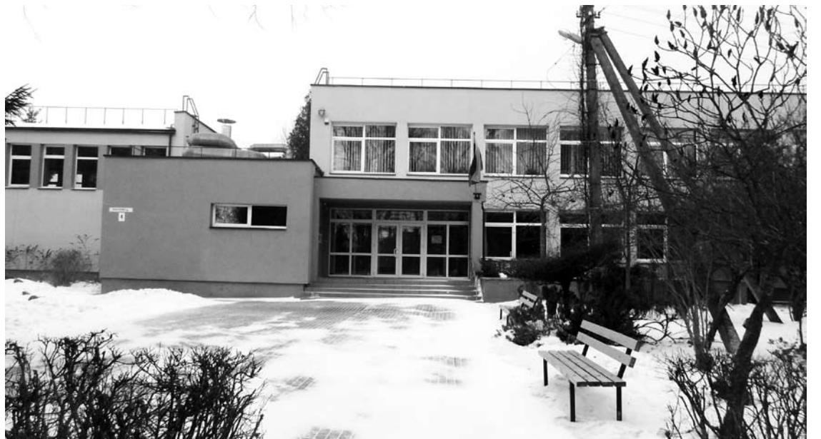
Traupio pagrindinė mokykla garsi savo mokytojais, mokiniais, botanikos sodu.