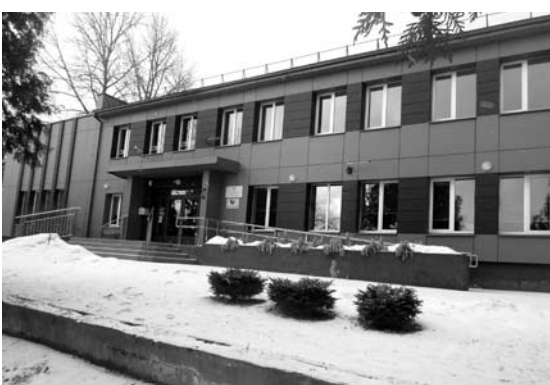
Neseniai restauruotame pastate telpa visa miestelio širdis: seniūnija, paštas, kultūros namai, medicinos punktas.

Savo nuomonę išsakykite paskambinę į „Anykštą“: (8-381) 5-82-46,