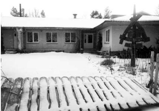
Ištuštėjusi Traupio šv. Martyno vaikų sodyba...